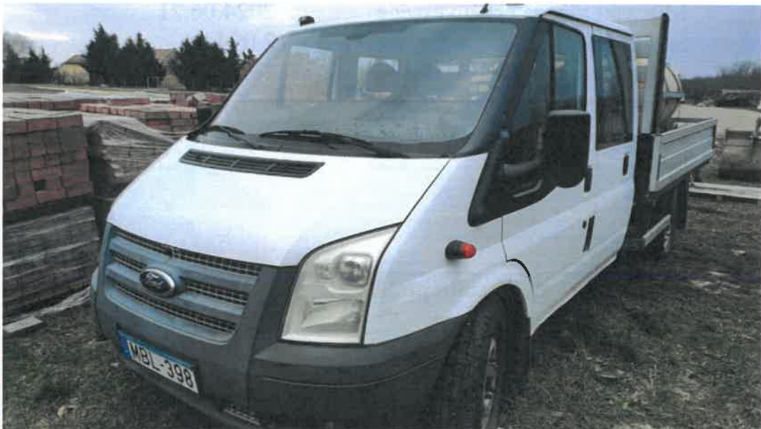
1. sz. kép: Az MBL-398 frsz.-ú üzemképtelen kistehergépjármű

A járművet Jánossomorján szemléltem le személyesen, típusának megfelelő futásteljesítménnyel rendelkezik, mely eredményeként elhasználódott esztétikai és elhasználódott műszaki állapotban van.