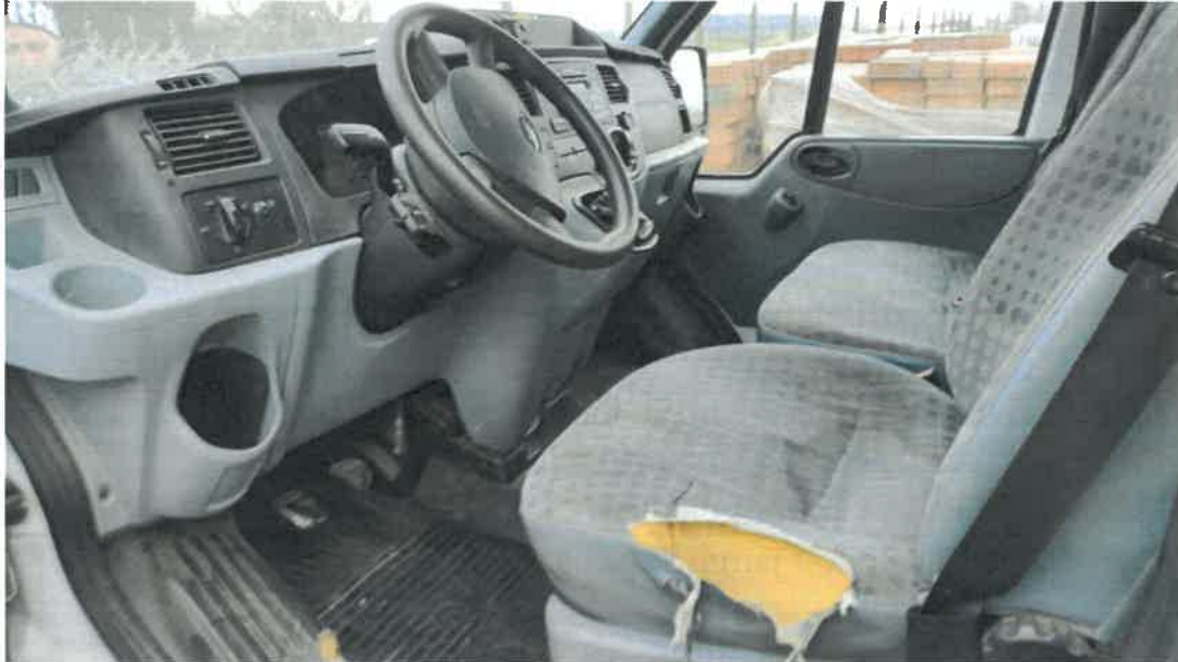
2. sz. kép: Erősen elhasználódott jármű belső