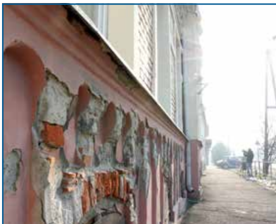
Rámutatunk a gondokra: Első helyre került a Klafszy a megye felújítandó iskoláinak sorában.

Kitart a Klafszy mellett az önkormányzat – 10 millió forintot különített el az idej költségvetésében Jánossomorja a Klafszy Katalin tagiskola legsürgetőbb felújításaira. Bár e forrás negyvenszerese sem lenne elég az iskola teljes felújítására, mégis szimbolikus az elkülönítés – jelzi, hogy a város nem hagyja sorsára az iskolát. Az oktatási intézmények működtetése állami kézbe került januártól, így a felújításra csak az állammal és a KLIK intézményfenntartóval közösen kerülhet sor. A győri tankerület leginkább felújításra szoruló iskolái között első helyen szerepel a Klafszy, vagyis felsőbb szinten is sikerült láttatnia a problémát a városnak. Pályázati forrás, vagy állami keret ugyanakkor jelenleg nem látszik e célra. Az önkormányzat a tankerülettel összefogva kell, hogy mindent megtegyen a jövőben az iskola felújításáért – mondta el Lőrincz György polgármester.