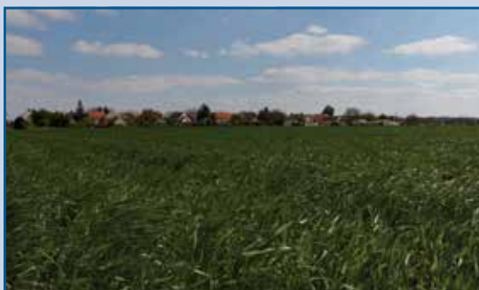
Őszre már akár eladhatóvá is válhatnak itt a telkek. Kiseb- bek és nagyobbak egyaránt várják majd a vásárlókat.

alább ennyit különítenének el erre, bár a teljes felújítás összesen közel 45 millióra rúg a felmérés szerint. Azaz, ha nem tud a következő két évben többet fordítani erre a város, akkor a programnak kell hosszabb távra gondolkodnia.