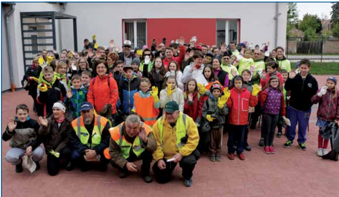
Szemétszedés harmadszor: Április 22-én, a Föld Napján újra száz önkéntes tisztította meg a város utcáit, száz zsák szemetet gyűjtve össze. Köszönjük az önkénteseknek, cégeknek, dolgozóknak, minden segítőnek és a gulyásról is gondoskodó polgárőröknek!