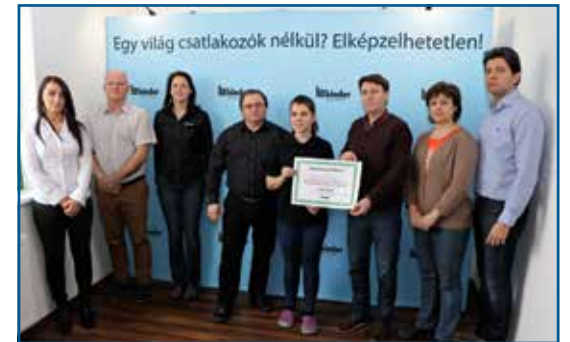
A Binder dolgozói és vezetése adta át az adományt.

Kétszázezer forinttal segítette a helyi iskolákat a Binder Cable Assemblies. A korábbi AMB Componentsből teljes profilváltással létrejött cég dolgozói adventi süteménysütéssel és a városi fényvárson forralt bort osztva gyűjtöttek. A jótékony akció keretében tavaly összegyűlt pénzt a vállalat megdupláztta. Ezt vehette át a városvezetés két képviselője Lőrincz György polgármester és Bella Zsolt alpolgármester március végén, a cég székhelyén. A polgármester példaértékűnek nevezte a cég és a város kapcsolatát, a Binder szerepvállalását. A vállalat ügyvezetője, Vida János elmondta, az üzem szeretne minél szorosabb együttműködést kialakítani a várossal, részt venni a helyi közéletben, számukra és a város számára is értékes célokat támogatva. A cég az elmúlt években is több városi programot segített, több százezer forint értékben, vagy épp a dolgozók aktív részvételével.