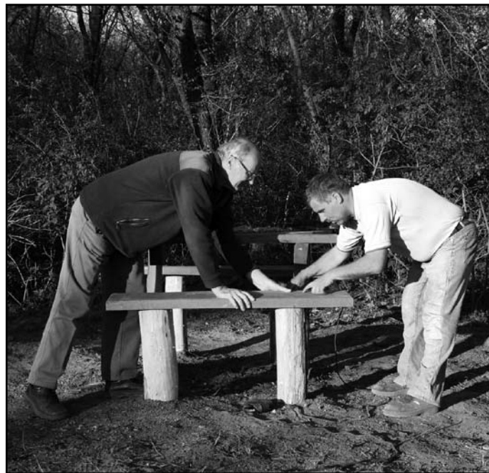
A civilek már szépitgették

nem volt állami, sem szövetkezeti tulajdonban. Láthatóan semmilyen szakmai kezelést nem kapott, csak időnként vágta ki belőle a szükségletnek megfelelő fákat, hol vastagot, hol vékonyat. Az egyes parcella határok nincsenek rögzítve, senki sem tudja, hogy pontosan hol van a birtoka. Ráadásul az öröklések révén már mintegy 250 tulajdonosa van a területnek. Ha a város, és főként a somorjaiak valamit kezdeni akarnak az erdővel, akkor azt csakis az összes tulajdonos írásos beleegyezésével tehetik.