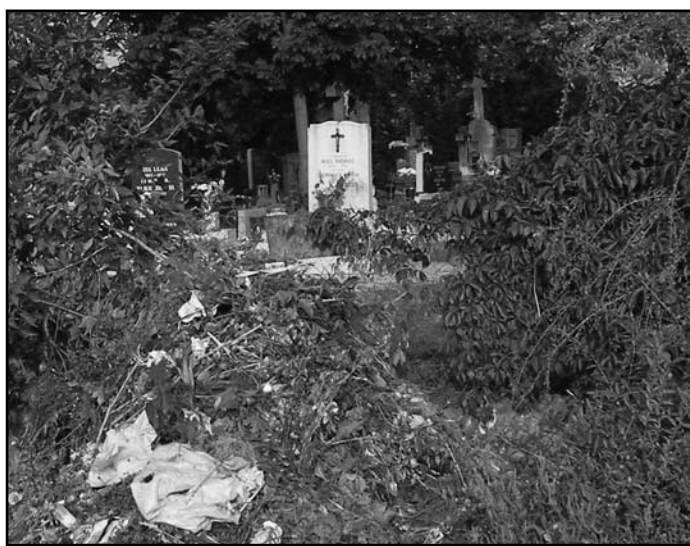
El kellene menni a kukáig

„Ha szeretne megfelelni a kor elvárásainak, akkor legalább egyszer hányásig le kell in-