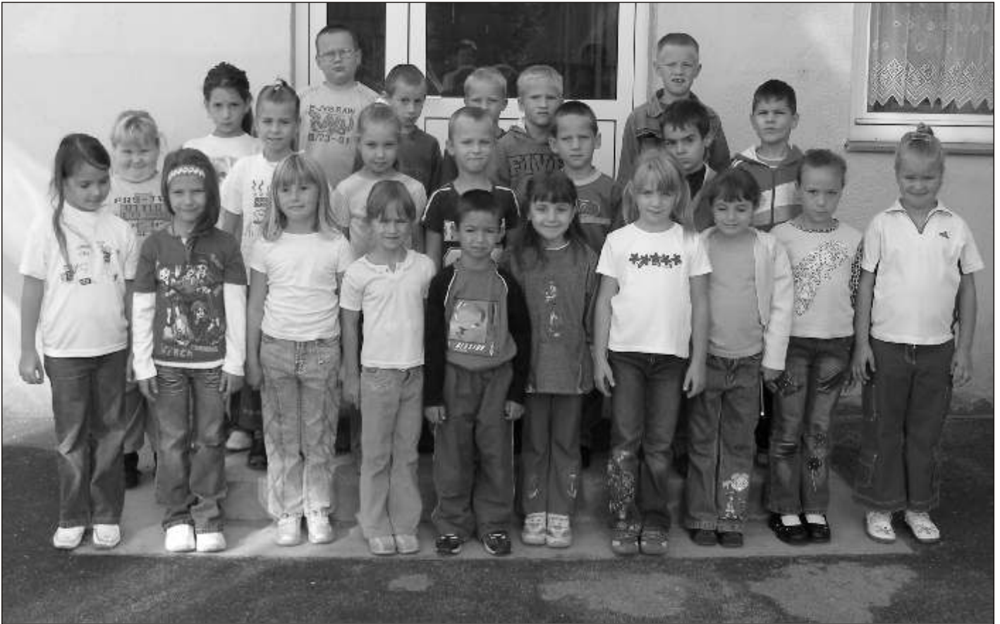
Körzeti Általános Iskola - 1. a osztály