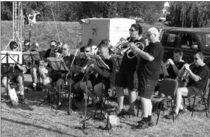
A Jánossomorjai Fúvós Egyesület. Felvételünk a Gödör Napokon készült

Családi ünnepet szervezett a Jánossomorjai Német Önkormányzat augusztus 12-én, vasárnap délután a mosonszentpéteri játszótéren. Környékbeli fellépőkkel, játszóházzal, malacsütéssel várták a kapcsolódni vágyókat.