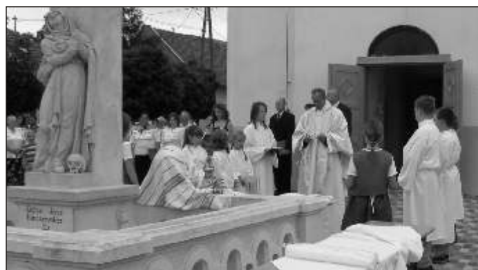
Szent István napi kenyérszentelés a somorjai templom előtt

A Polski után egy másik kategóriájú jármű, a Zetor ro-