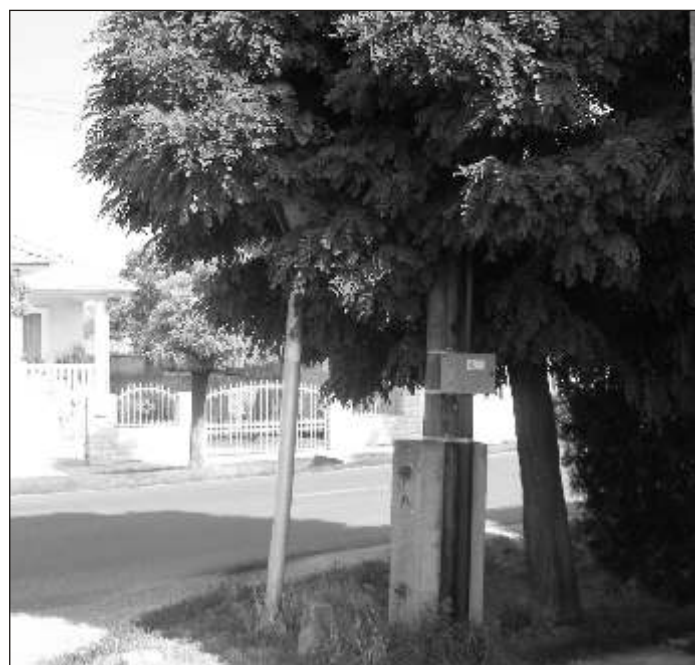
Közlekedési tábla a Móricz Zsigmond utca végén