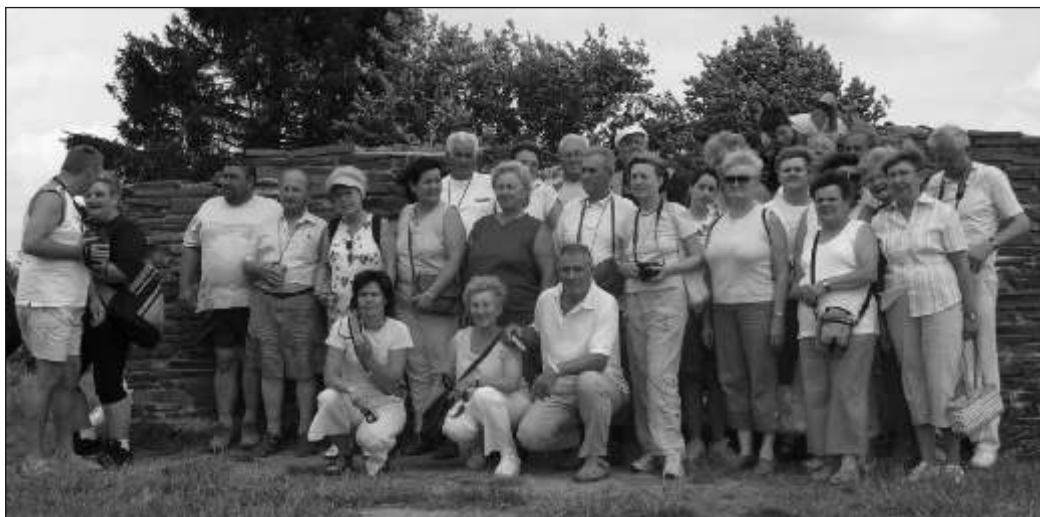
Csoportkép a Vereckei hágó emlékhelyénél

mének egyik falára a Fesztői Árpád körkép részletét, másik falára Szent István képét festette rajztanárunk. Szépen felszerelt számítástechnikai termük van. A termekben és a folyosón szép képek, ízléses falújságok tanuskodnak hazafias nevelésükért. Az igazgató úr ügyes szervező, jó kapcsolatteremtő. Több magyarországi iskolával tartanak kapcsolatot, és a Norvég Vöröskereszt is támogatja őket felszereléssel. Szükségük is van rá, mivel az állami normatív pénzüket még a tantermek festését sem fedezi. Visk vonzáskörzetéből is ide járnak iskolába a gyermekek. Az igaz-