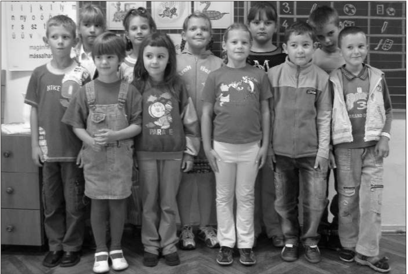
Klafszky Katalin Tagiskola - 1. osztály