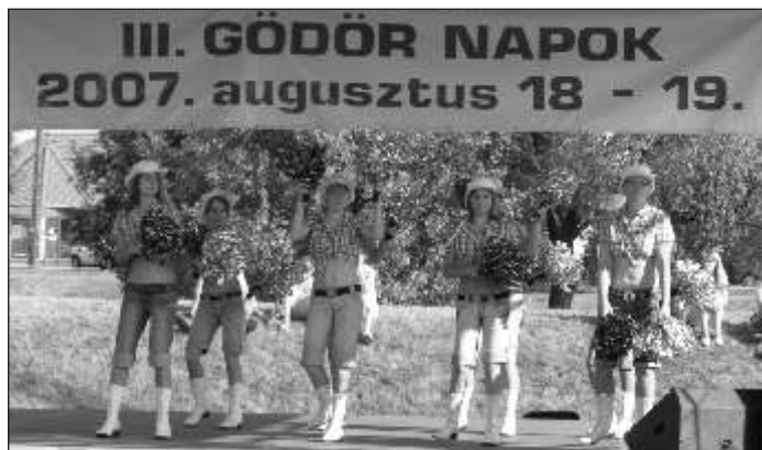
A pázmándfalui mazzorettek nem elszőr szerepeltek Jánossomorján